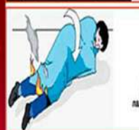
Рис. 8. Гасіння палаючого одягу

Побачивши людину в одязі, що горить, слід накинути на неї пальто, плащ або будь-яке покривало й щільно притиснути їх до її тіла (мал.8)