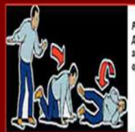
Рис. 7. Дії в разі займання одягу

Якщо сталося займання одягу, лягти на землю (підлогу) й перекинутися з боку на бік, щоб збити полум'я (бігти не можна, бо полум'я посиляться) (мал. 7)