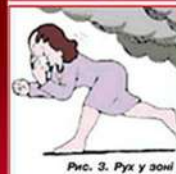
Рис. 3. Рух у зоні задимлення

У дуже задимленому приміщенні пересуватися поповзом або зігнувшись. Для захисту органів дихання від чадного газу дихати крізь зволожену тканину