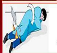
Рис. 8. Гасіння палаючого одягу

Якщо сталося займання одягу, лягти на землю (підлогу) й перекинутися з боку на бік, щоб збити полум'я (бігти не можна, бо полум'я посиляться) (мал. 7)