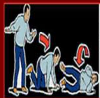
Рис. 7. Дії в разі займання одягу

У дуже задимленому приміщенні пересуватися поповзом або зігнувшись. Для захисту органів дихання від чадного газу дихати крізь зволожену тканину