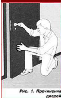
Рис. 1. Прочинення дверей

5. Якщо бачите, що сил згасити не вистачає, то покиньте небезпечну зону.