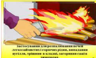
Застосування для розпалювання печей легкозаймистих і горючих рідин, випалювання вугілля, тріщини в скляні, загоряння сажа в димоходах.