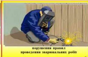
порушення правил проведення зварювальних робіт

Не можна допускати контакту речовин і матеріалів, взаємодія яких призводить до горіння, вибуху або утворення горючих чи токсичних газів