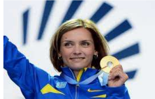
Інеса Кравець Олімпійська чемпіонка 1996 р оку в потрійному стрибку.