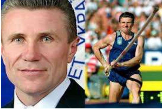
Сергій Бубка Олімпійський чемпіон зі стрибків з жердиною