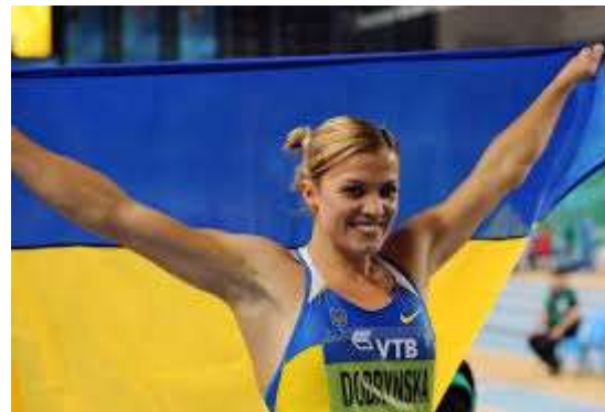
Наталія Добринська українська спортсменка, многоборка. Олімпійська чемпіонка 2008 року